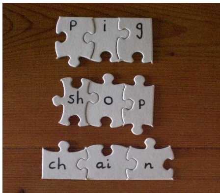
កំរូ Jigsaw Puzzle Words